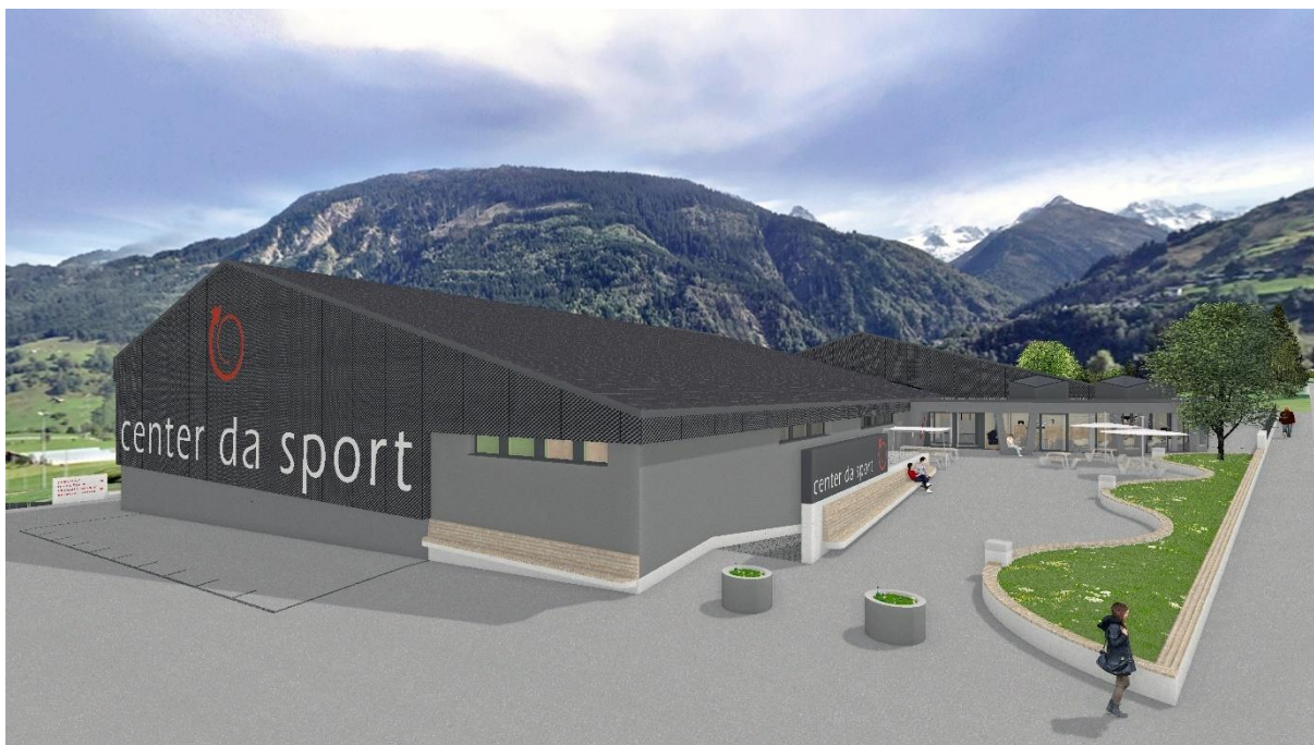
Vesta sin il CSC cun l'entrada e la nova caffetteria ed il niev plaz davon quella, che vegn medemamein formaus da niev.