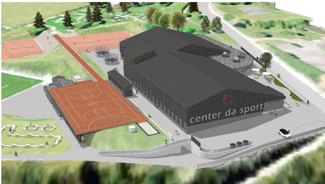
Denter il center ed ils plazz da tennis ei il pumptrack da veser.