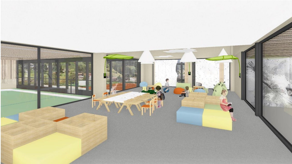
Anteriura caffetaria vegn nezegiada da per differentas purschidas per affons.