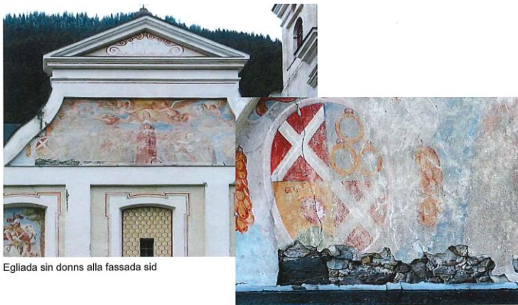
Egliada sin donns alla fassada sid

Denton ein las fessas vid las fatschadas ed egl intern digl edifices sco era auters donns buca pli da surveser. Ina renovaziun totala dalla baselgia sogn Martin semuossa pil convent, tuts experts involvai e visitaders urgenta ed indispensabla.