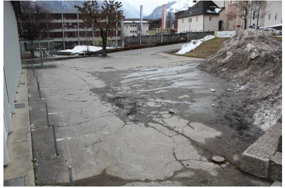
Vesta dil plaz avon scola veglia enviers plaz avon halla Cons