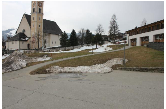
Vesta sil plaz che vegn sanaus