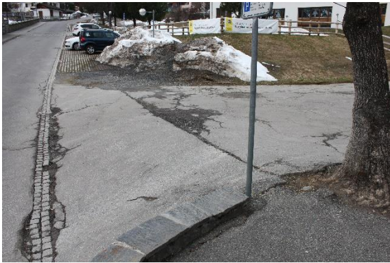
Entrada dalla Via Cons sil plaz avon halla Cons