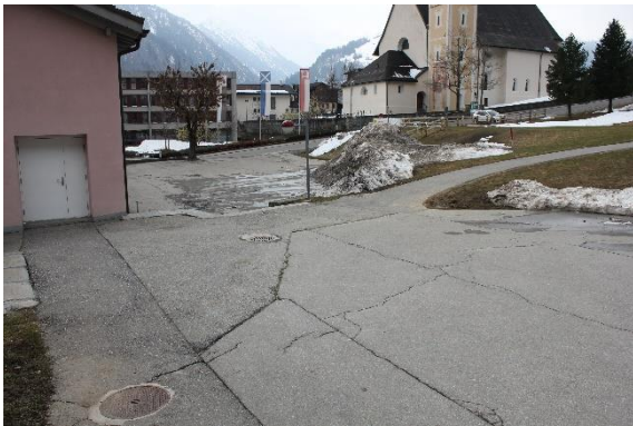
Plaz avon scola veglia