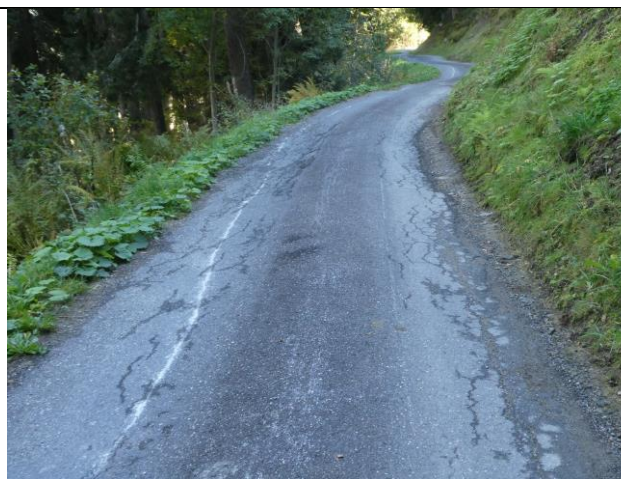
Tgierp dalla via deformada e sbassada, situaziun 2019