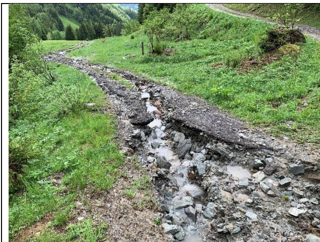
Devastaziun dalla via funsila egl uost 2019