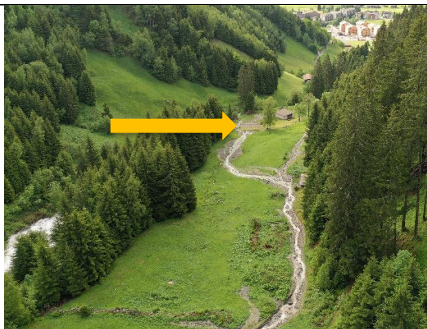
Donns da cultira e vid implonts dalla Spina da Vin (mira paliet) igl onn 2019