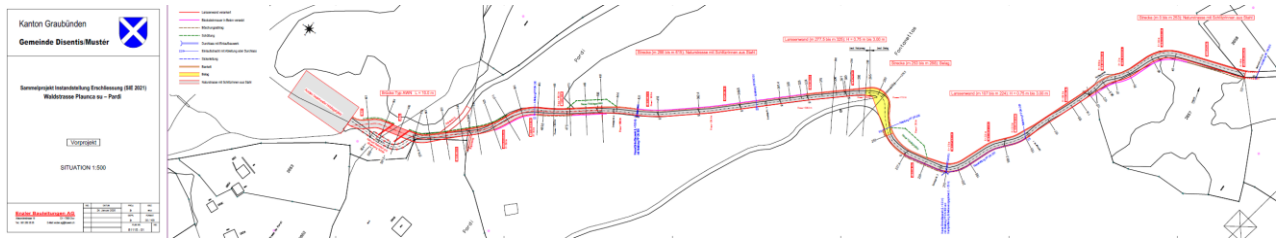
Situazioni SIE 2021 Plaunca Su - Pardi

Las finamiras dil project ein da reparar ils donns vid las ovas. El rom dallas reparaturas necessarias vid il tgiertp dalla via vegn era il profil interior ("Lichttraumprofil") reconstruius, aschia ch'el corrispunda alla norma "WaldstrasseSTANDARD" digl uffeci d'uaul e prighels dalla natira dil Grischun. Il passadi a Pardi dalla Val d'Uors duei vegnir surmuntaus niev cun ina punt da 10 m lunghezza e 4.5 m ladezia. Sin pliras parts ei previu da rimnar las auas dalla spunda e menar naven talas. La fundaziun actuala ei vegnida analisada. Tenor il resultat dall'analisa ei quella fundaziun buca stabila avunda e sto vegnir remplazzada completamein. Las scarpas vegnan segiradas cun ovas da sustegn.