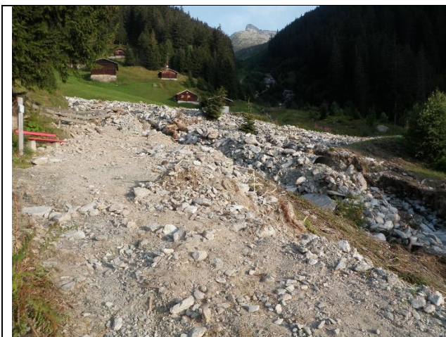
Devastaziun dil passadi entras la bova el decuors digl onn 2011

La via d'ual contonscha 172.5 ha uaul cun ina provisiun da lenna da bien 60'000 tfm. Tenor las calculaziuns per l'utilisaziun dalla lenna el plan da menaschi per tgirar quels uauls munta il quantum annual a biebein 500 tfm. Quei vul dir ch'els proxims 40 onns vegnan 20'000 tfm transportai sur la via d'ual. Supplementarmein al diever forestal porta la via d'ual access a differents mises, survescha schibein al diever agricol sco era al diever turistic (pista da skis, via da velos, senda da viandar) e porscha access all'infrastructura pil provediment d'aua ella Val Acletta. En mira alla situaziun munglusa dall'ovra ei ina reparatura e sanaziun da tala indispensabla.