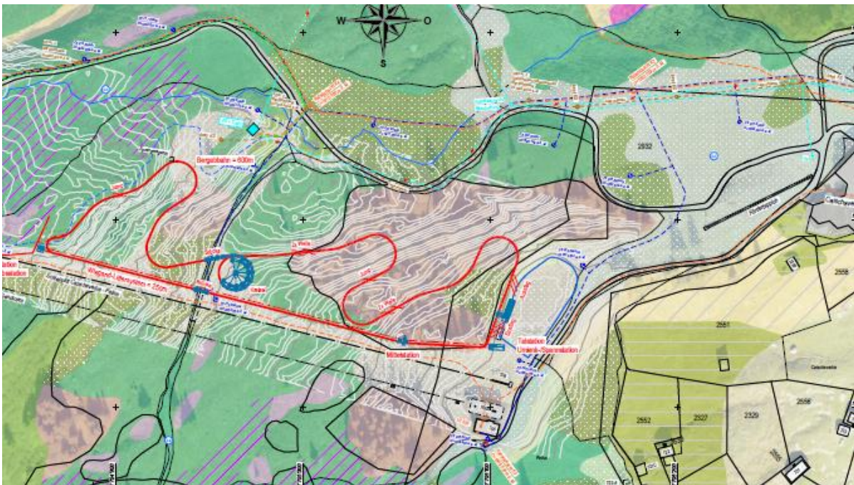
Plan da project cun plan da zonas

La definiziun d'ina scursalera basegna primarmein la fixaziun da quella el plan general d'avertura. Per saver possibilitar la distanza da cunfin denter il baghetg ed igl ur digl uaul basegna ei denton la definiziun d'ina lingia da distanza digl uaul. Plinavon eis ei necessari da schaffir in spazi d'aua pil dutg che percuora igl anteriur laghet. Ultra da quei han ils uffecis cantunals constatau ch'ei manca ina lubientscha da baghegiar per la piazza da giug che sesanfla oz enteifer il perimeter dil laghet buca pli existent. Pia eis ei era en quei cass necessari da considerar enzacons fatgs.