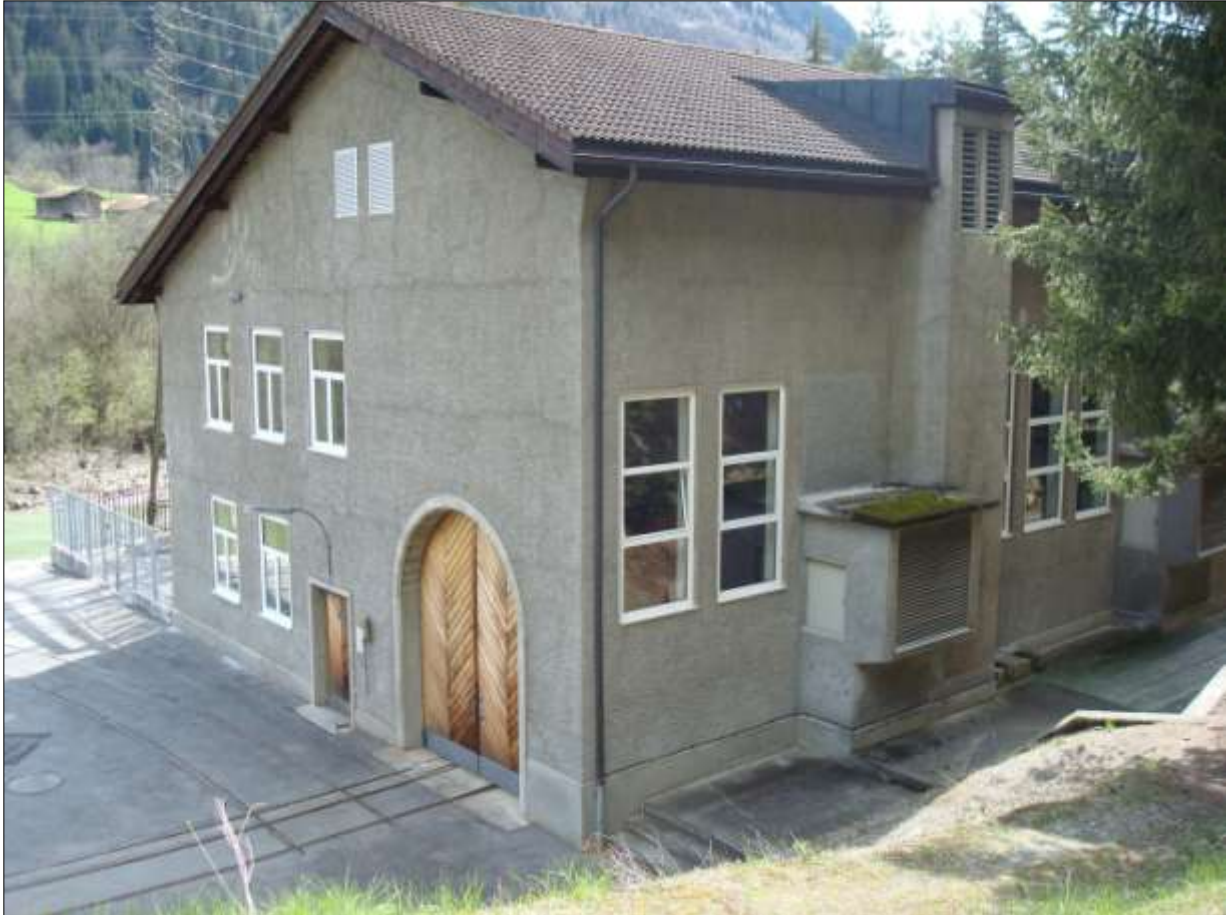
la centrala davart encunter damaun