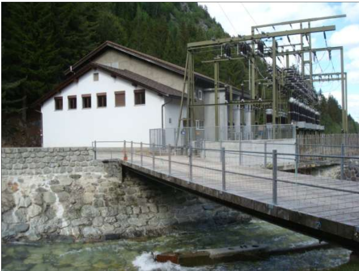
centrala davart encunter sera

Il baghetg ei vegnius completaus igl onn 1983 cun in baghetg annex da vart encunter sera e cuntegn denter auter la stanza da commando ed ulteriuras stanzas pil menaschi.