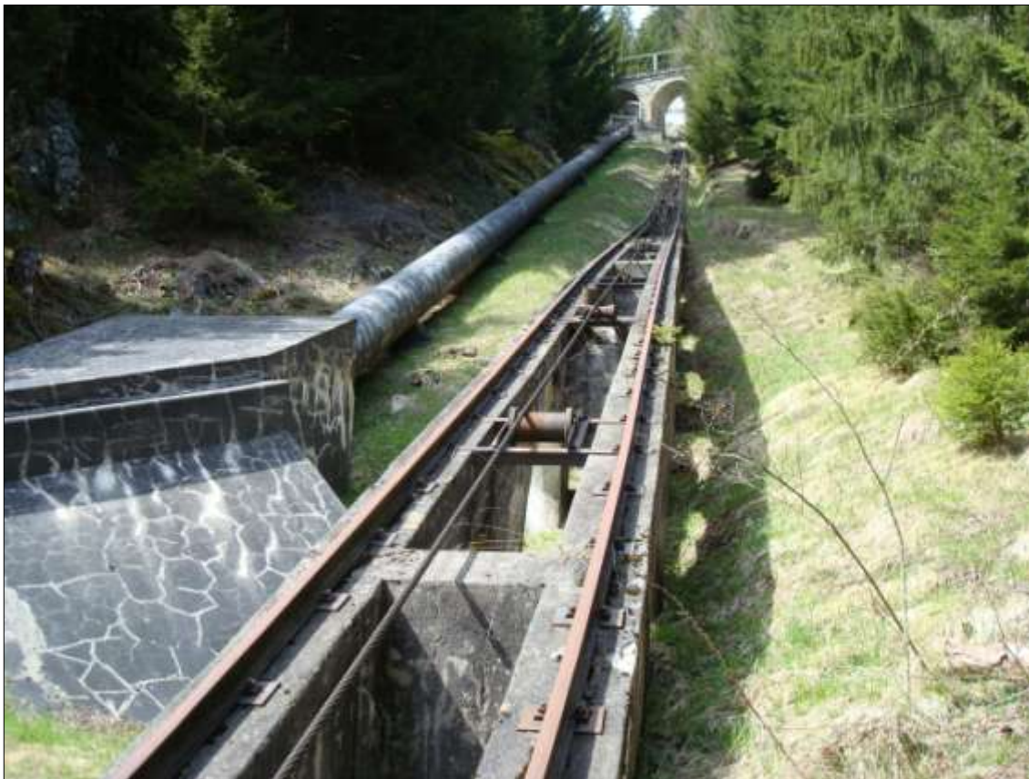
lingia da pressiun gest sur la centrala

La lingia da pressiun actuala meina l'aua naven dil lag a Barcuns entochen ella centrala sper il Rein. La lingia ei 2230 m liunga ed ha in diameter denter 900 e 1100 mm. Gest suenter il lag flessegia l'aua tras ina stolla cun ina lunghezia da ca. 85 m ed in diameter dad 1.85 m entochen tier il baghetg cul scludider dalla lingia. Naven da leu meina ina lingia da fier, per gronda part sur tiara, l'aua entochen ella centrala. La scadenza brutta maximala dall'ovra existenta munta a 396.25 m. La lingia da pressiun orda fier ei gia sils onns e sto vegnir remplazzada.