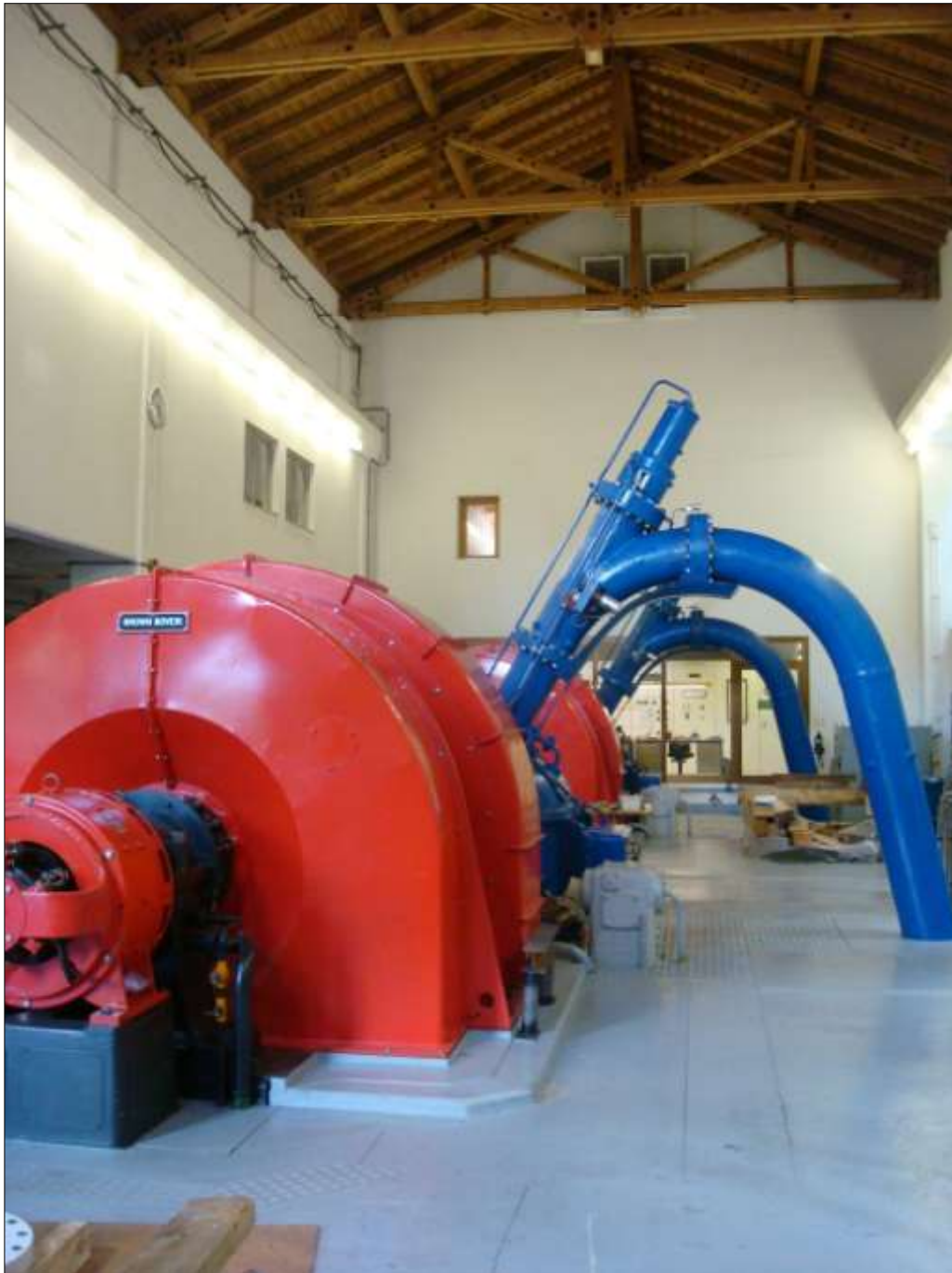
centrala cun sala da maschinas

Adattaziuns ein previdas mo egl intern dil baghetg, aschia che la cumparsa anoviars resta pli u meins sco tochen dacheu.