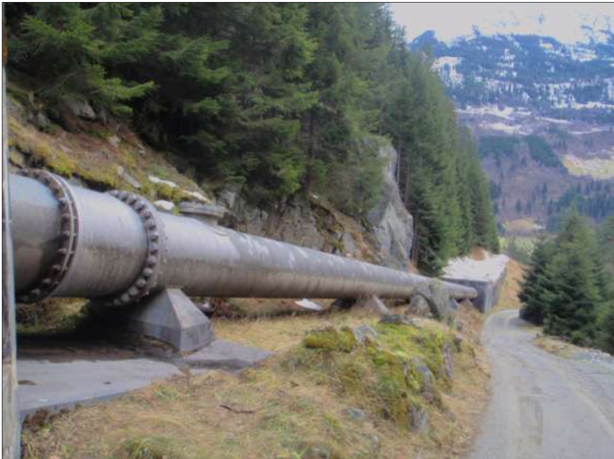
lingia da pressiun e via el Malpass

Igl access actual sut il Malpass satisfà buca allas pretensiuns per in access segir durant il temps da baghegiar. L'avertura dil plazzal a Barcuns e la construcziun dalla lingia da pressiun pretendan in access segir e carrabels cun autos da vitgira, pia ina via cun dameins pendenza.