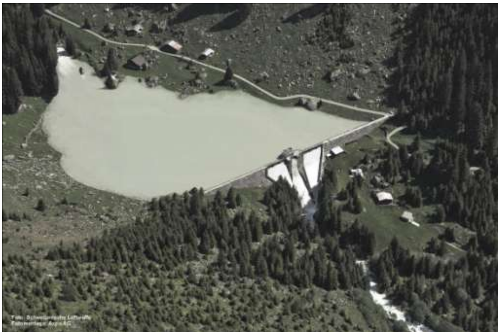
lag da Barcuns cun alzament dil mir per 5 m