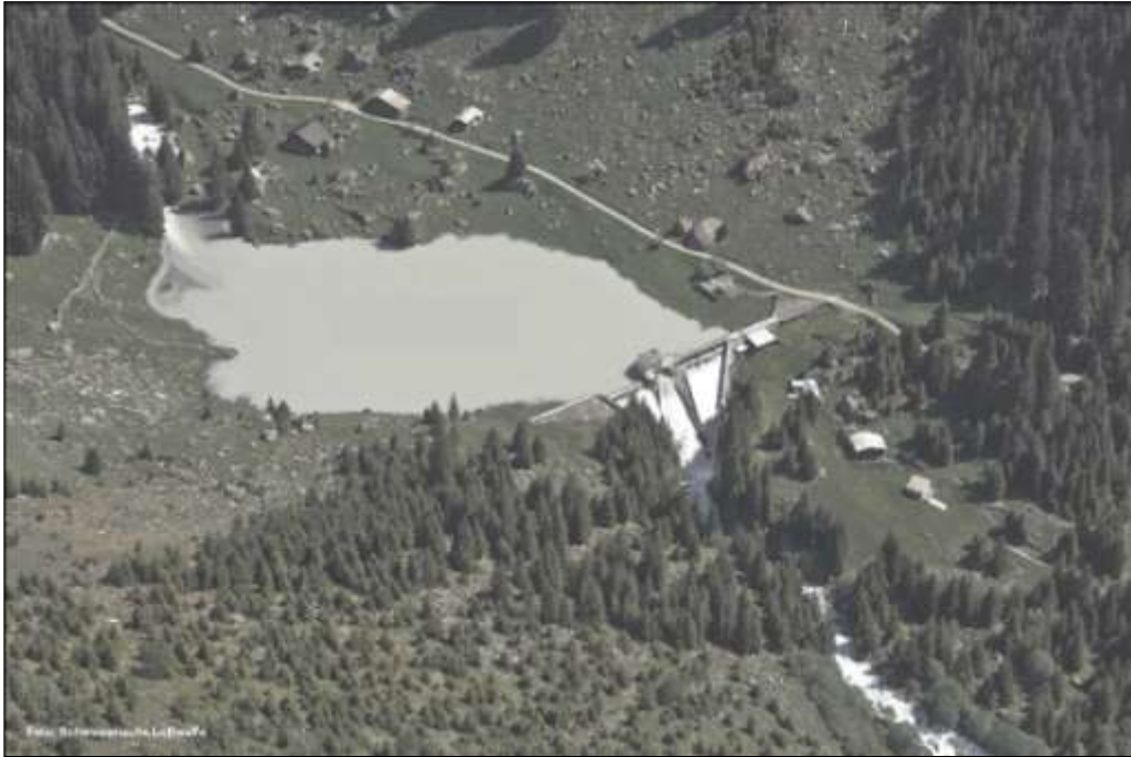
lag da Barcuns 2010

Il mir a Barcuns duei vegnir alzaus per 5 m, quei ch'augmenta il volumen dil lag da 115'000 a 210'000 m 3 . Il mir niev ei 33.5 m aults. Ils meins october tochen mars cun pouca aua sa quella vegnir accumulada el lag da fermada durant las uras da tariffa bassa, vul dir la notg e la sonda e dumengia, per lu vegnir turbinada il temps da tariffa aulta. Durant quels meins sa il nivel dil lag sesbassar e sesalzar enteifer ina jamna per tochen 20 m. Ils ulteriurs meins cun bia aua vegn quella turbinada directamein, aschia ch'ei dat lu mo minimalis svaris dil nivel dil lag. La quantitat maximala d'aua tschaffada per la produziun vegn augmentada dad oz 4.0 sin niev 7.0 m 3 /s. A basa da quei quantum d'aua, che sa vegnir utilisaus cumpleinamein mo durant rodund 45 dis ad onn, vegnan las turbinas ed ils generaturs sco era ils ulteriurs indrezs dalla centrala dimensiunai.