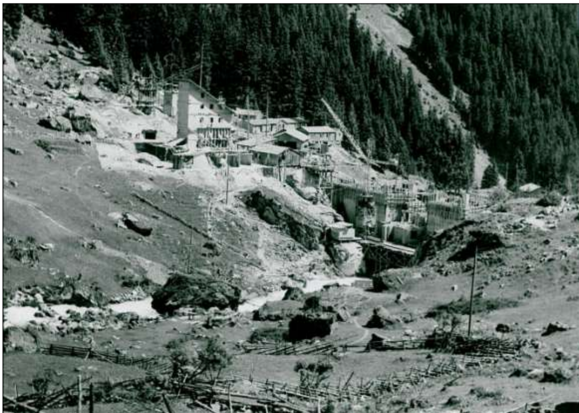
construcziun dil lag da Barcuns 1946/47