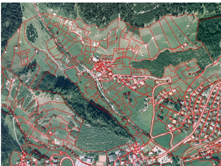
Situaziun dallas parcelas a Clavaniev, nua ch'ina meglieraziun funsila ha aunc buca giu liug.

Dapresent cultiveschan 40 menaschis purils terren, da quels 28 menaschis principals e 12 menaschis accessoris. Ella media cultivescha in menaschi 15.74 ha: in menaschi cumplein 19.17 ha ed in menaschi accessori 7.72 ha. 11 menaschis cultiveschan meins che 10 ha, 16 denter 10 e 20 ha ed 11 menaschis ina surfatscha da sur 20 ha.